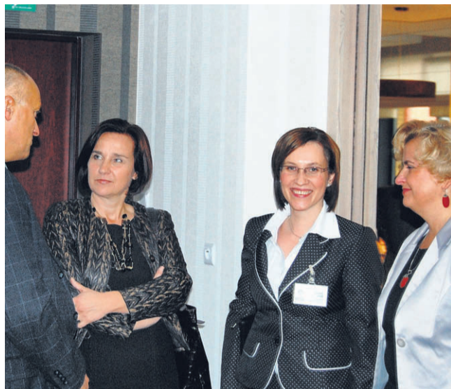
Podczas konferencji rozmawiano m.in. o przyszłości szpitala